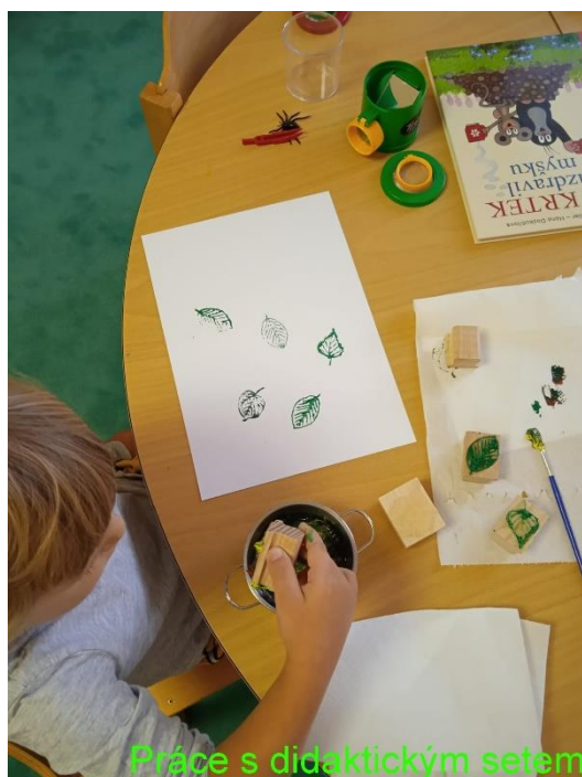
Práce s didaktickým setem

poznávání přírodnin: didaktický set obsahující dvě bedny slouží k ukládání přírodnin a pomůcek za účelem jejich poznávání a zkoumání. Děti přiřazují k přírodninám obrázky, které mají na mozaice víka druhé bedny, pozorují změny textury a barvy přírodnin v časovém horizontu způsobené povětrnostními podmínkami