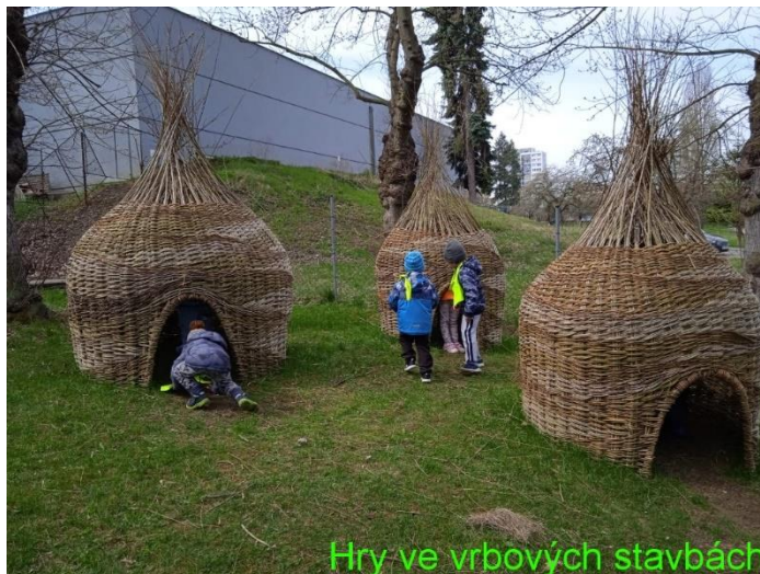
Hry ve vrbových stavbách

vrbové stavby: struktury vzájemně propletených organických materiálů, vertikálních a horizontálních prutů; vrbové stavby posilují u dětí pocit pospolitosti a sounáležitosti se světem, podporují sociální vazby mezi dětmi, včetně možnosti nastavení společných pravidel soužití a vytváření prostoru k seberealizaci; individuální činnost a hra uvnitř vrbové stavby přináší dítěti pocit klidu, jistoty a pohody