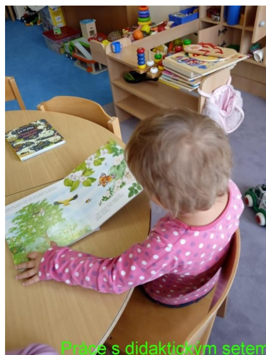
Práce s didaktickým setem